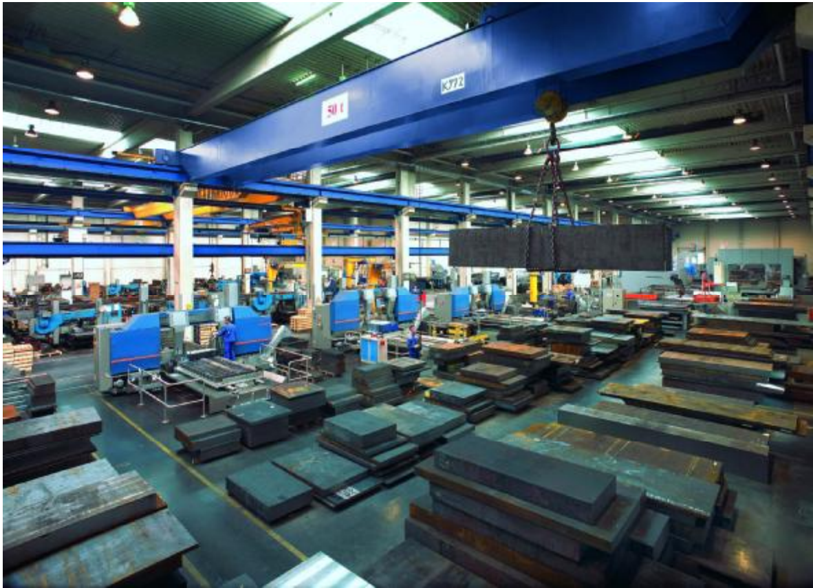
Bildunterschrift: Mehr als 85 Bandsägen laufen Tag und Nacht bei EschmannStahl im Dauereinsatz.