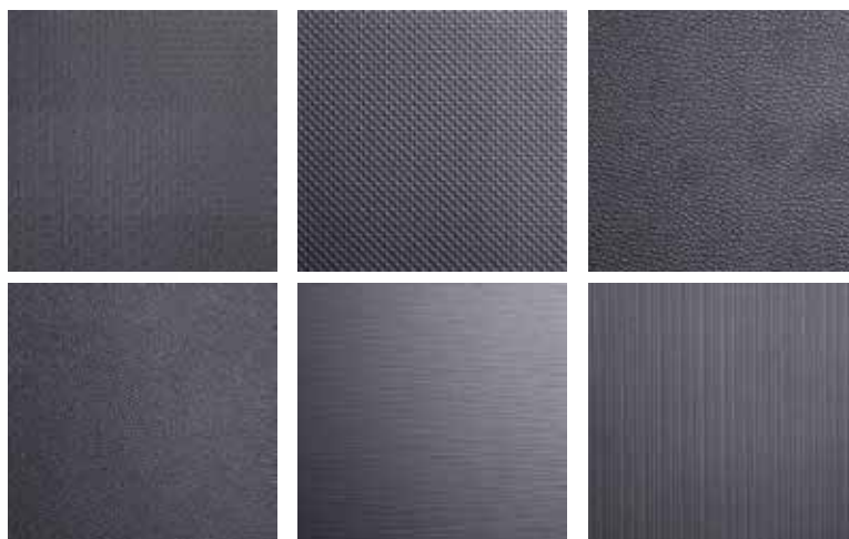
Der Oberflächengestaltung sind fast keine Grenzen gesetzt.