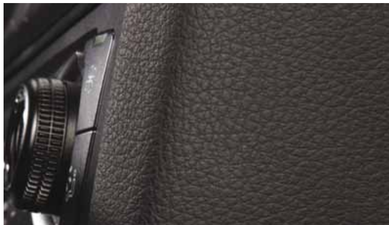
Hervorragende Narbeigenschaften garantieren hochwertige Oberflächen.